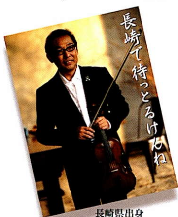
長崎県出身 さだまさしさんからのメッセージ