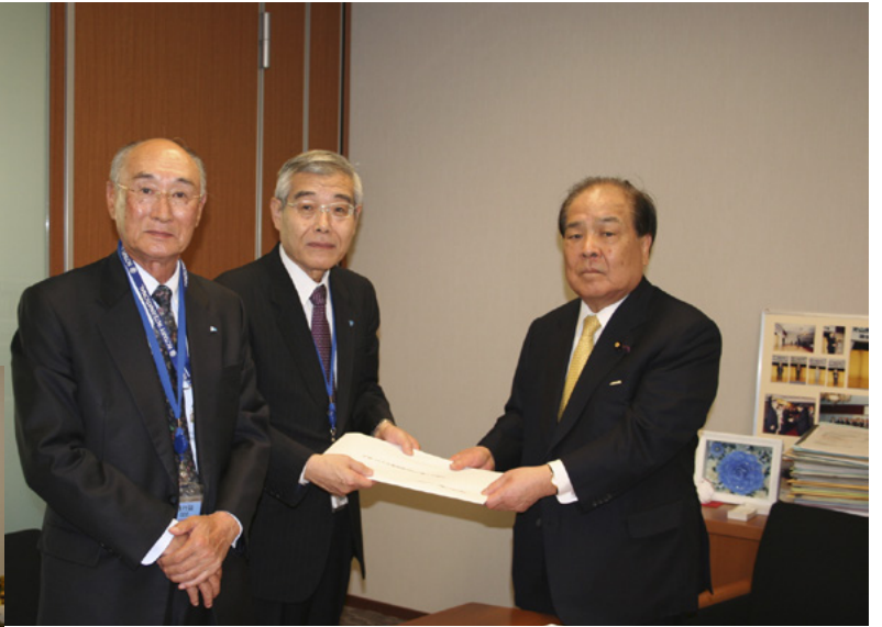
右から 片山税制調査会長、柳田税制・税務委員長、 長谷川税制・税務副委員長