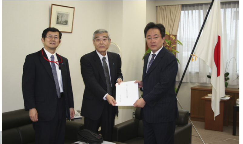
右から 北川長官、柳田税制・税務委員長、横山専務理事